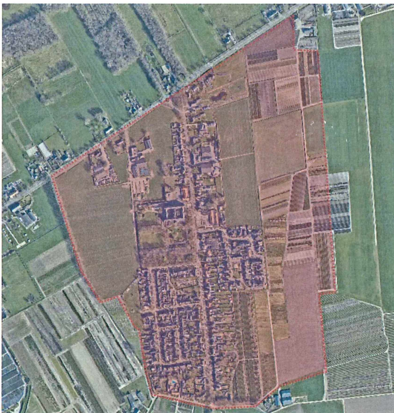
Figuur 1: Dorp Biezenmortel

Als contouren voor dit dorpsakkoord hanteren we in de basis het gebied zoals is weergegeven in figuur 1 en laten we het buitengebied buiten beschouwing.